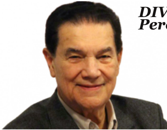
DIVALDO Pereira Franco